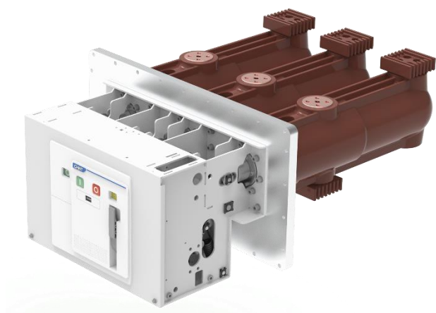
NV77-40.5 真空断路器 (配充气柜)