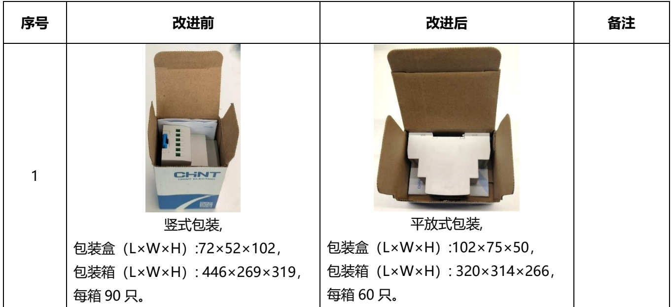
表 1 NJYB3 电压保护继电器产品包装变更前后对比