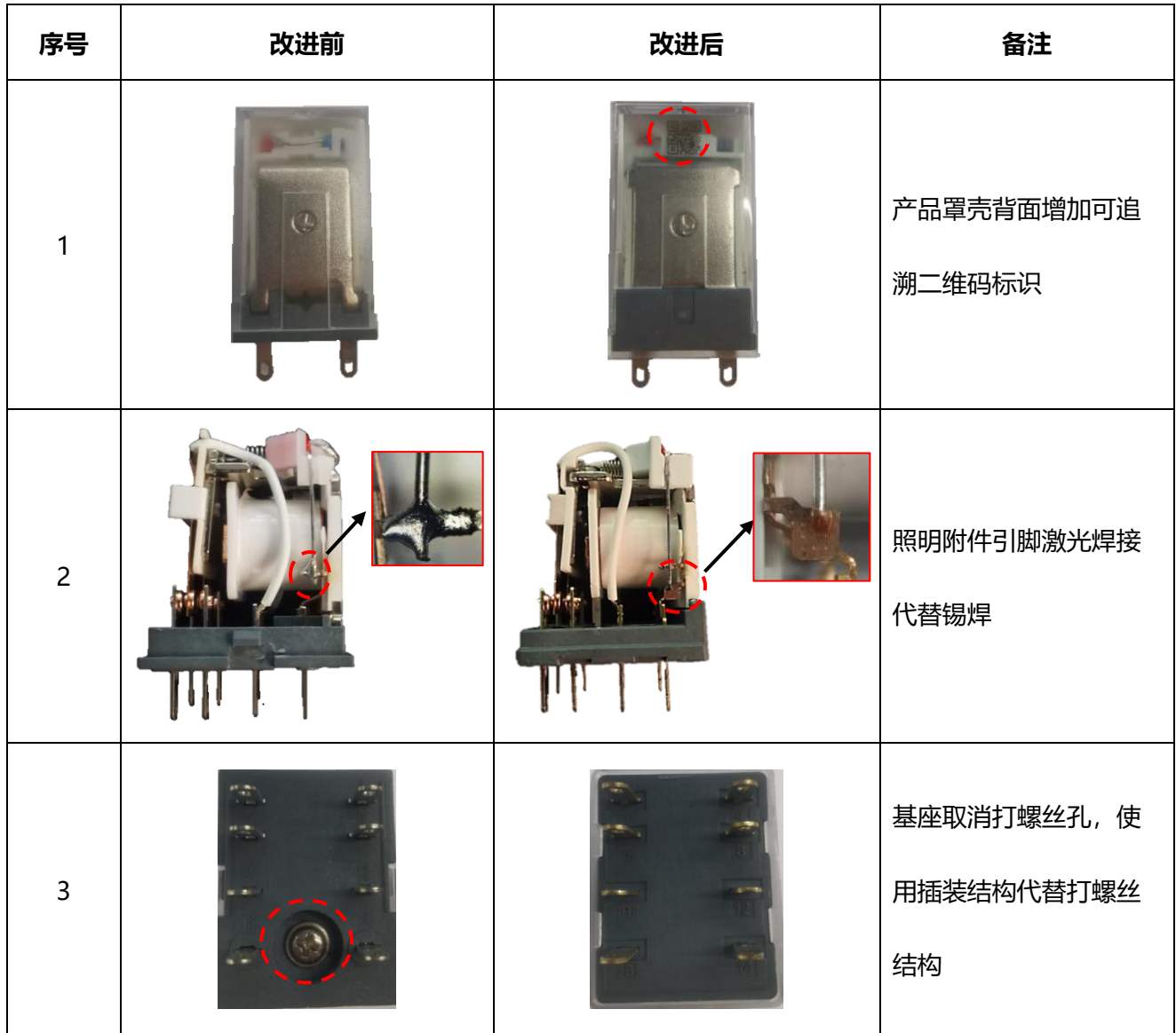
表 1 NXJ/2Z 小型电磁继电器产品改进前后对比